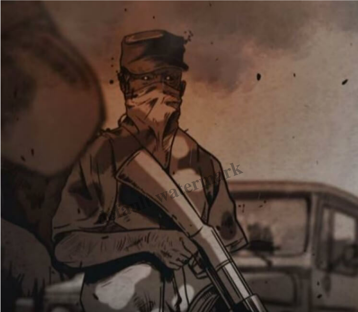
Las masacres responden a una violencia localizada y a la disputas de distintos grupos armados